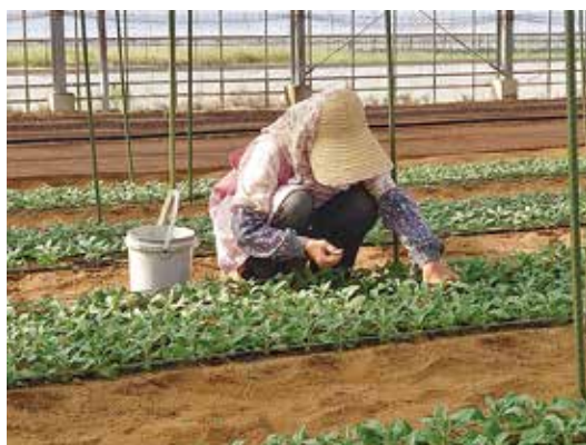
▲今後、農業をどう成長させるかが町の課題

画の策定を提案し、「農家の皆さんから頂いた貴重な意見を参考に検討する」という回答だったが、現在の進捗状況はいかがか。