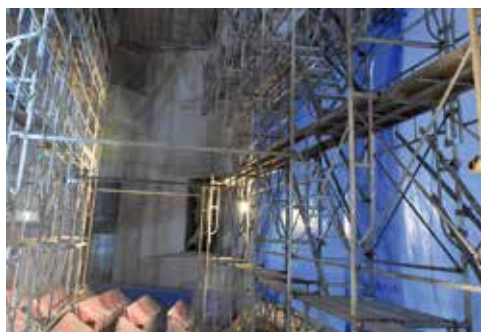
▲文化センター天井耐震改修工事の様子