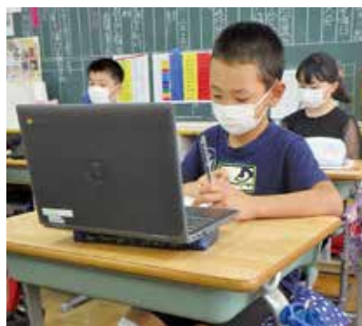
▲タブレットの活用方法は今後どのような広がりを見せるのか