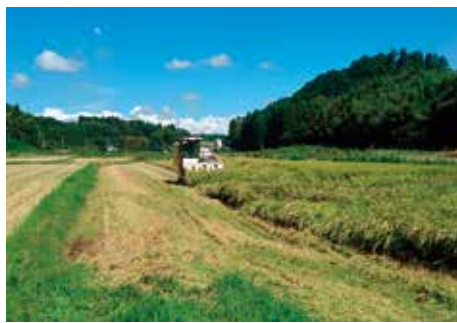
▲近年、飼料用米などへ転作も進む稲作