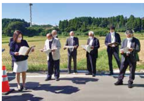
▲小池地区の道路改良工事の完成箇所の視察風景

全議員により構成された「決算審査特別委員会」で、3日間合計14時間を費やして慎重審議した結果、令和3年度の町会計収支を全会一致で認定しました。