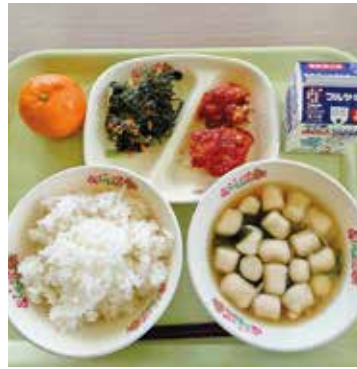
▲子供たちから人気もあり、メニューも豊富な学校給食

A 日頃、学校給食で地産物の使用があるときは、校内放送で児童・生徒に周知しております。また、給食の賄い材料をできる限り地産物を使用することに心掛けております。