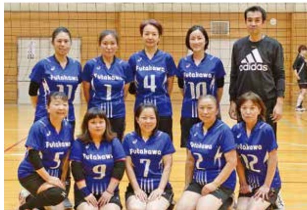
▲バレーボールが大好きで、とても和やかな雰囲気ของทีม二川のみなさん

が好きで、住んでいる千葉市から、飛行機を見にわざわざ足を運んできます。他にも芝山仁王尊は建物が立派だし、はにわ博物館もあって、芝山町ってたくさん見るところがあるよね。」