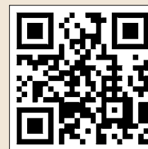
▲国税庁ホームページ