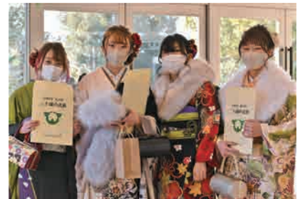
< 表紙 >

成人年齢の改正後、初めて行われた「二十歳の式典」。級友との再会を果たし、各々が過ごした青春の日々の思い出話に花を咲かせていました。