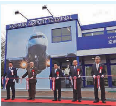
▲昨年の10月1日にオープニングセレモニーが挙行されました

さらに、航空科学博物館、ひこうきの丘、空の駅「風和里」、水辺の里などのスカイパーク芝山の中の新たな観光スポットとして期待されています。