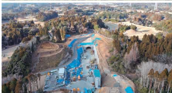
▲芝山トンネル南抗口部 (上:令和3年10月、下:令和5年1月撮影)

トンネル工事の現場の山の地質は、粒子が細かい「砂質土」という砂で成り立ち、さらにトンネル上部から地表までの距離(土被り)が平均10mと浅いため、非常に崩れやすく、流砂現象による崩落や陥没の危険性があるため、安全を最優先にした掘削工法を採用しています。