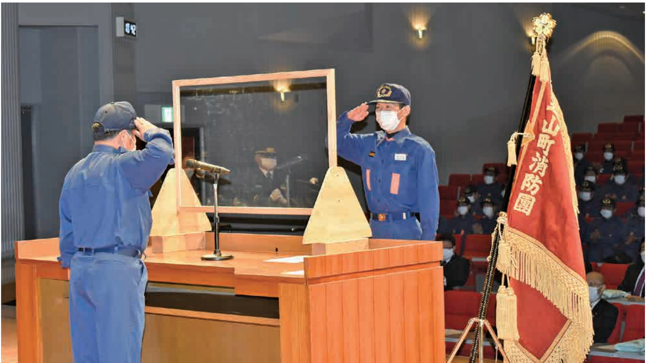
▲消防団員として、町の安全に心を込めて敬礼

消防署芝山分署の消防署員が参加しました。表彰式では、25人が表彰を受け、長年に渡る消防活動の功績を称えられました。