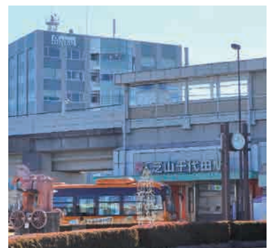
▲芝山町唯一の交通結節点 「芝山鉄道・芝山千代田駅」