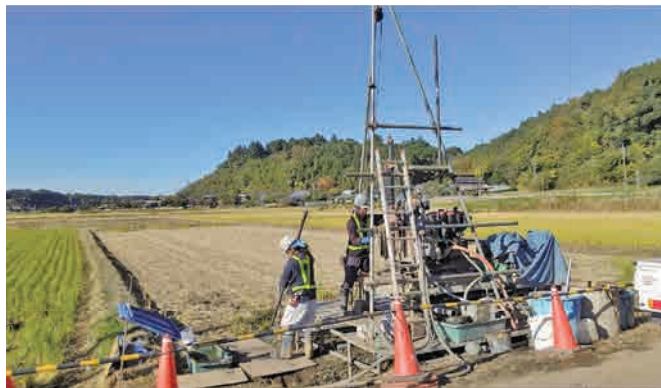
▲仮称『高谷川沿い道路』予定地地盤調査