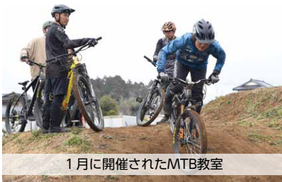
1月に開催されたMTB教室

また、4月8日には、高橋大喜プロのMTB講習とビギナーズスクールを開催予定です。ぜひご参加ください。(詳しい内容は空輪ホームページへ)