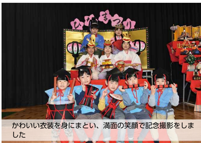
かわいい衣装を身にまとい、満面の笑顔で記念撮影をしました