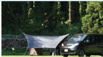
開放的な空間でキャンプを楽しめます

キャンプをしたことがない方は、レンタルもありますので、デイキャンプからチャレンジしてみてください。