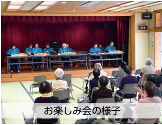
お楽しみ会の様子