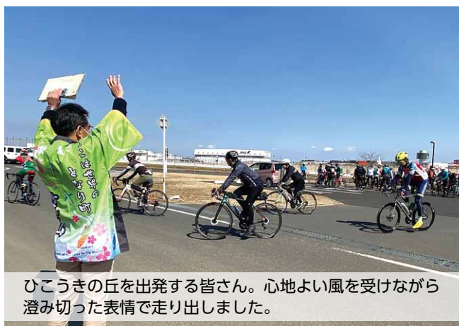
ひこうきの丘を出発する皆さん。心地よい風を受けながら澄み切った表情で走り出しました。

当日、おゆうぎ室に用意された衣装や道具を見ると「この服が着たい」「太鼓が持ちたい」など、ワクワクした様子で話す子どもたち。お雛様、お内裏様、三人官女、五人囃子に変身し、みんなで楽しく桃の節句をお祝いしました。