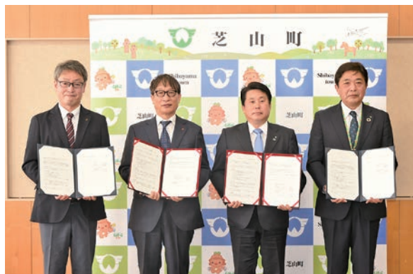
▲左から内山観光学科長、杉林学長、麻生町長、佐久間副町長

また、協定書における観光の振興に関する連携協力の具体的な取り組みに係る事項などについて覚書も併せて締結しました。