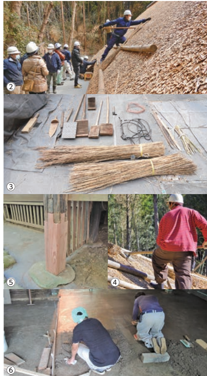
①工事が完了した旧敷家住宅全景②令和3年度に開催した現場見学会では間近で屋根葺きの様子を見学した③屋根葺きに使う道具④職人による丁寧な仕事⑤腐った柱は「根継」で補修した⑥土間は昔と同様に土、砂、石灰、にがりをを使い、手で叩いて固めた