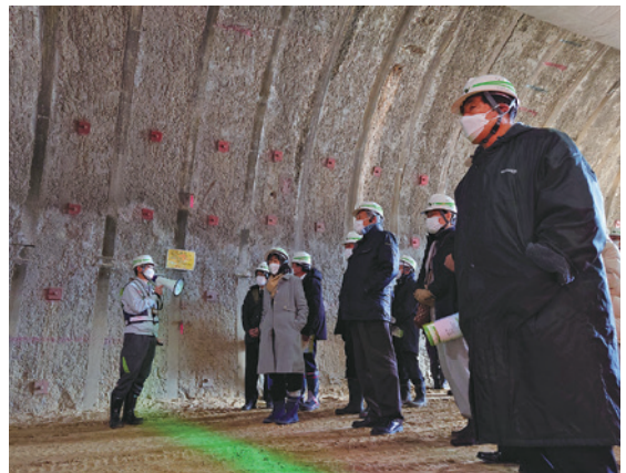
▲トンネル掘削の様子を見入る議員団

また、同時に工事が進んでいる、仮称芝山トンネルも現在の進捗状況の説明を受けました。