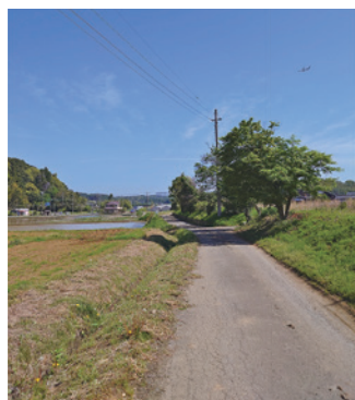
▲拡幅が求められている山中東地区道路

答 【町長】 拡幅工事に向けて必要となる業務を精査したところであり、今後道路測量や設計に取り組みます。