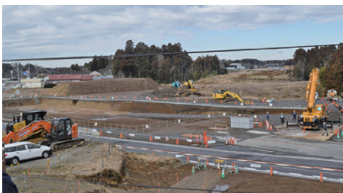
▲インターチェンジ予定地付近