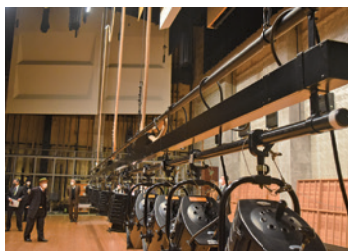
▲普段は目にする事のない文化センター吊物ワイヤーロープ

〔般〕文化センター舞台吊物装置ワイヤーロープ取替工事 1299 万 3 千円 照明や幕、音響反射板など舞台吊物のワイヤーロープ 取り替え工事を実施します。