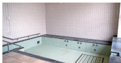
▲福祉センター内大浴場

〔般〕福祉センター給湯設備等改修工事 6500 万円 老朽化した給湯設備等を改修し避難所としての機能 強化を図ります。