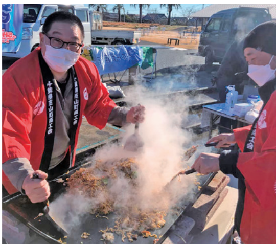
▲焼きそば作りに定評のある青年部のみなさん

「やっぱり町内の産業の発展だと思います。私たちも商売人ですので、町内の業者のみなさんがさらに元気になると嬉しいですね。地元の企業が商売を頑張る、そしてその企業が頑張っていくために町が支える、そうすることで町の産業がどんどん発展していき、町自体の発展にも大きく貢献していくと思うので、私たちも精一杯頑張っていきます。」