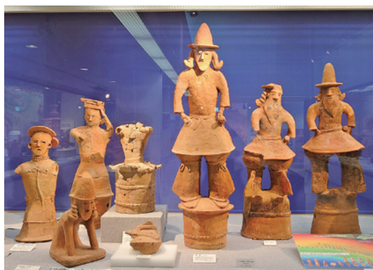
▲希少価値の高い芝山のはにわ。もっと上手に観光に活かしたい。