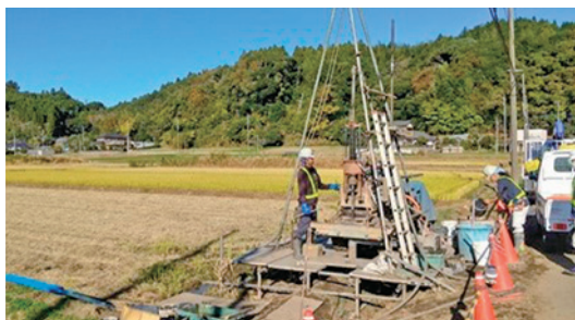
▲高谷川沿い新設道路のための地質調査

公 菱田地先配水管布設工事 5891万2千円 菱田移転代替地等において需要者に水道水を供給するため管路を布設します。