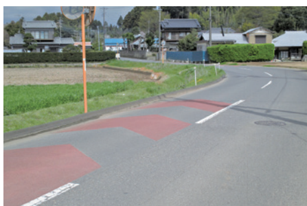
▲交通量の多い生活道路を修繕