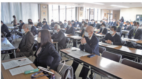
▲午後からは多古町役場にて研修