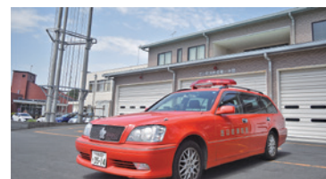
▲現行の消防団指揮車