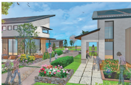
▲※田園居住地イメージパース