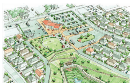
▲※小池地区イメージパース

般 町道3BL-0095号線(新井田)道路改良事業 4000万円 小池地区拠点整備において基軸となる道路を整備するための用地購入費。