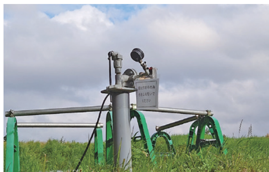
▲朝倉地区の水道取水予定地に設置された調査用井戸

公 岩山地先配水管布設工事 6735万3千円 川津場移転代替地等において需要者に水道水を供給するため管路を布設します。