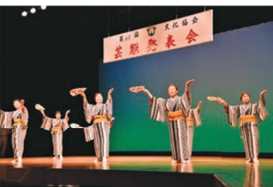
▲舞台上で様々な芸能が発表される様子。