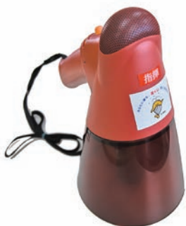
購入物品は「クーちゃん」シールが目印です。

■目的 災害時の早期避難を呼びかけることに活用するために、町消防団に配備しました。また、拡声器の重要性を再確認することで、消防団員個人の活動意欲を高めることが期待されます。