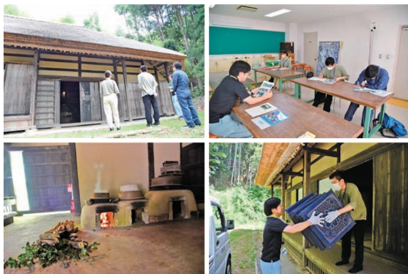
▲実習を受ける3人の学生と藪家内での作業の様子。

芝山古墳・はにわ博物館で、3人の大学生が8月2日から9日までの8日間、学芸員資格取得のため博物館実習を受けました。3日(木)には、博物館で町学芸員による講義を受講し、その後、芝山公園内にある旧藪家住宅で文化財の日常管理について学びました。