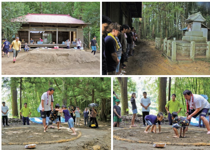
▲鹿島神社に集まり、子供たちが真剣勝負をする様子。