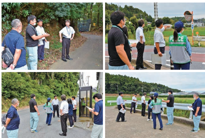
▲関係者が通学路の危険箇所を点検する様子。