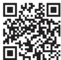
↑ラブラッド アクセスQRコード