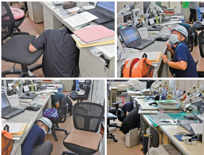
▲本庁舎のシェイクアウト訓練を行う様子。

9月1日(金)防災の日に芝山町全域で地震の揺れから身を守る安全行動訓練(シェイクアウト訓練)が行われました。訓練には町内19団体、1499人が参加しました。防災行政無線の指示に従い、速やかに3つの安全行動(まず低く・頭を守り・動かない)をとっていました。