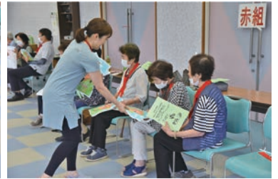
▲様々なゲームを行った後、景品をもらう様子。