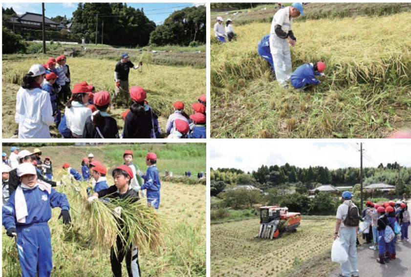
▲小学生が稲の刈り方を聞き、刈る様子。

稲刈り当日は、台風13号の影響もあり足場が悪く、猛暑でしたが、元気いっぱい収穫の秋を体験しました。最後は、コンバインでの刈り取りも見ることができ、刈り取りスピードの速さに驚いていました。