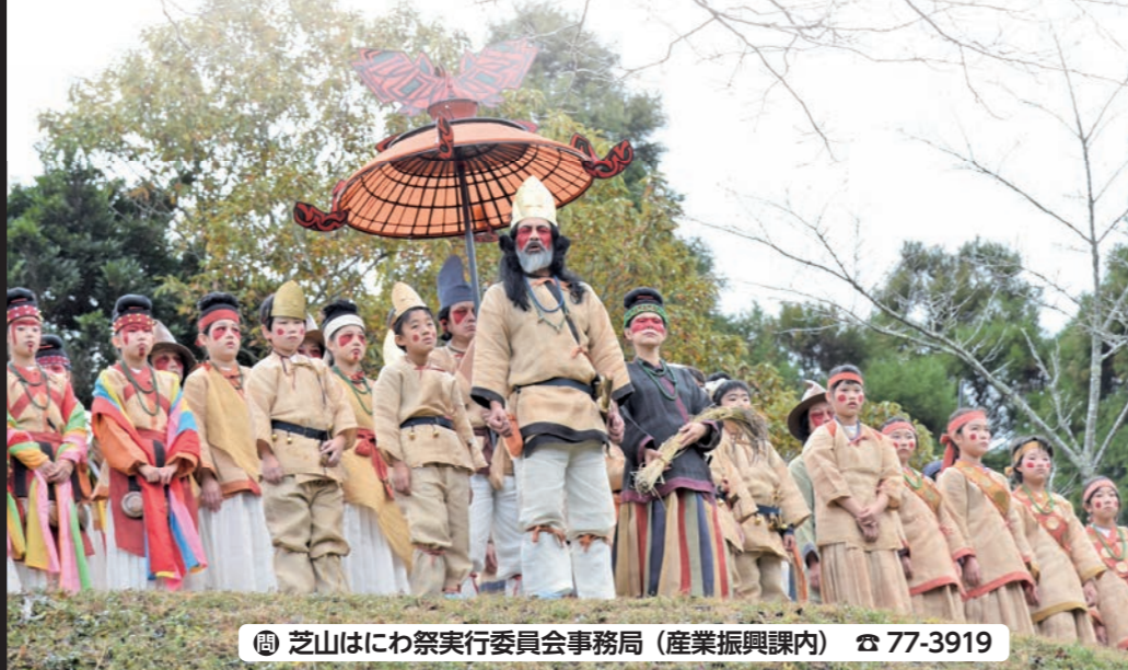
芝山はにわ祭実行委員会事務局（産業振興課内） ☎ 77-3919