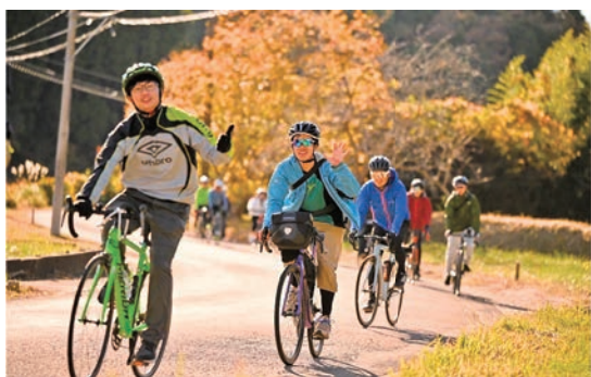
▲モンベルフレンドエリア九十九里 サイクル部会主催で行われました

当日は天候にも恵まれ、芝山町からは7組(22名)が参加し、全員、踏破することができました。