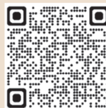
▲キャッシュレス納付

国税は「キャッシュレス納付」が便利です。スマホアプリ納付や振替納付のほか、インターネットバンキング、ATM、クレジットカードで納付する方法もあります。詳しい内容は、国税庁ホームページを確認してください。