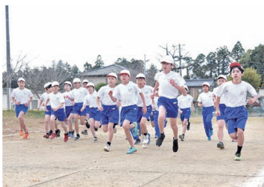
▲スタート直後の激しい位置争い