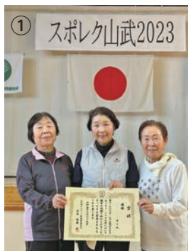
①ボッチャ・シニアの部 優勝 わんわんチーム ②ユニカール・ファミリーの部 優勝 KとG