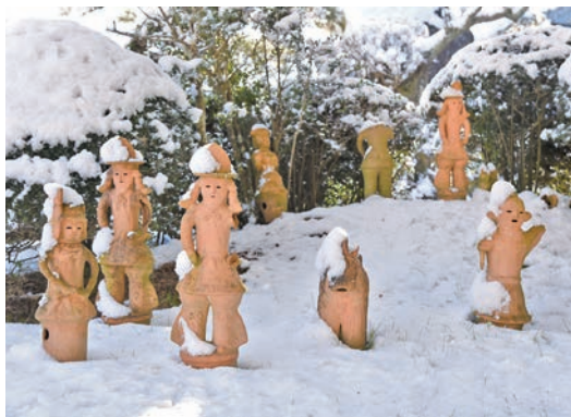
冬の寒さに負けず、元気にお過ごしください！