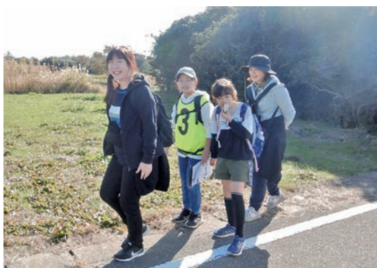
▲家族でゴールを目指して

各学年で男女分かれて走り、合計12レース行われました。学年によっては激しい一位争いがあったり、走っている児童の応援コールが起きるなど、校内は大きく盛り上がりました。