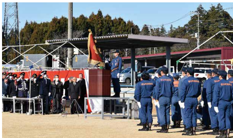
▲日ごろの消防活動の成果を称える出初式

前夜の雪が嘘のように穏やかな青空のもと、スポーツ広場で挙行された令和6年出初式。今回は4年ぶりに小隊訓練と機械点検も行われ、団員の規律を確認しました。町消防団から31名、東消防署芝山分署から4名、そして3つの分団がそれぞれ表彰を受け、長きにわたる町への防災活動への貢献を讃えられました。