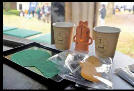
▲オリジナルキャラクター「ハニージョ」のランタンとコーヒーカップ