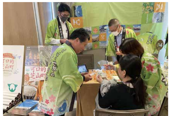
▲台北市での商談の様子

問 不登校となった児童・生徒に対する学習支援のサポートはどのように対応しているのか。 答 【教育長】放課後に児童生徒を登校させて授業を行うたり、タブレットを貸し出し、学