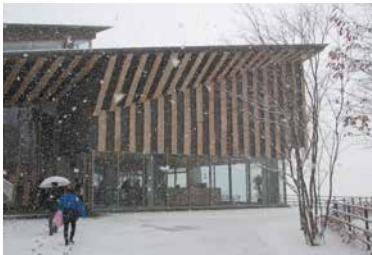
▲最新の入浴施設「キトウシの森きとろん」