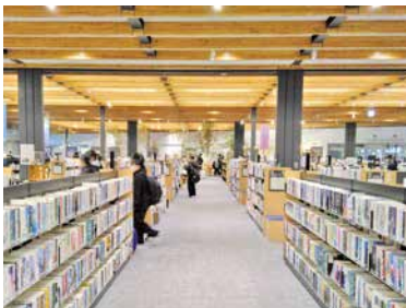
▲図書館と文化ギャラリーが両立した「せんとぴゅあII」