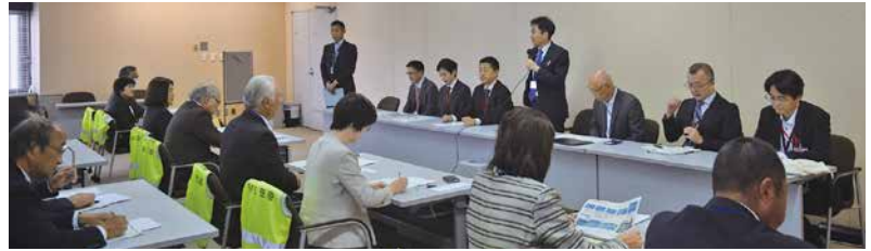
▲羽田空港の騒音対策を参考にできるかが課題

成田空港の第3滑走路建設工事が始まるのを目前に、羽田空港を視察し、人口の多い首都圏上空を飛行機が行き交うため、その騒音対策など、様々な工夫点について学ぶことができました。