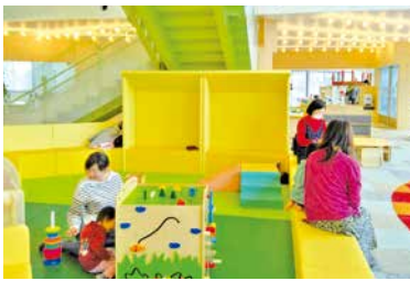
▲親子連れに人気の「東川町共生プラザそらいろ」