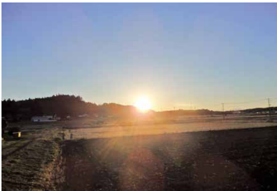
▲未来の町づくり (2024 元旦の日の出)

答 【町長】複数の交通機関の連携を強化し、包括的に自宅と目的地を結ぶ仕組みを構築することです。