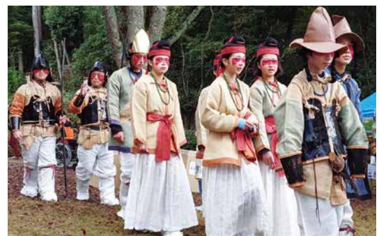
▲私たち現代人と交流をする儀式に向かう古代人たち

前回は古代人の儀式のみで行われた芝山はにわ祭り。コロナ禍が明けた今回は本来の形に戻し、すべての儀式と数多くの出店が軒を連ね、祭りの集客に一役を買いました。祭りの終盤では、商工会による餅投げ大会も開催され、私たち議会議員も参加しました。