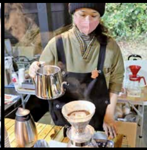
▲本格的なドリップで