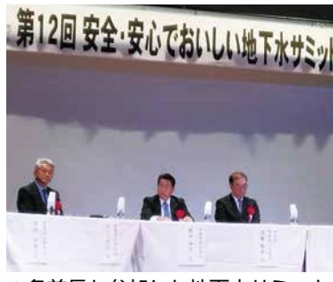
▲各首長も参加した地下水サミット