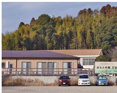
▲旧東小学校グラウンド内に建つ特別養護老人ホーム

この日、公有財産利活用推進委員会が開催され、町執行部から総務課財政担当課長、契約管財係長が出席し、旧東小学校利活用事業の進捗状況と公共施設の管理方針に関して説明を受け、活発な意見を交わしました。