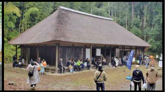
▲千葉県指定有形文化財「旧藪家住宅」

「あつたらいいな」をカタチにした エネルギーシユな女性たち！ —あの大盛況だった旧藪家での古民家カフェですよね。来場したお客さんがあの建物の中で暖かいコーヒーやお茶を飲んでくつろいでいる姿が印象的でしたよ。 「おかげさまで、多くの方は来ていただきました。当日は天気も悪く、お客さん