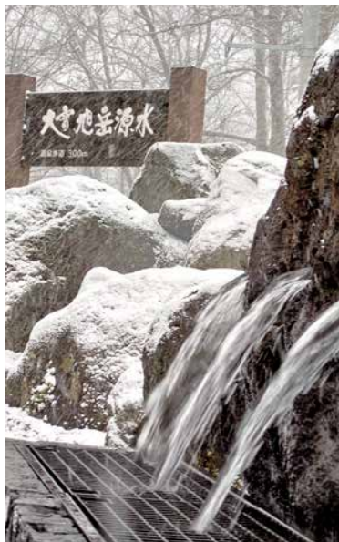
▲大雪山連峰「旭岳湧き水」