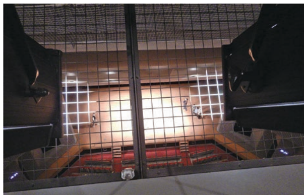
▲客席天井の照明部屋から見下ろしています