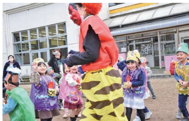
▲鬼を怖がる子どももいる中、楽しそうに豆まきをする子どもたち

1月27日(土)に開催された若竹塾。3組のご家族が参加され、舞台から客席を眺めたり、長い階段をのぼって客席天井にある部屋からピンスポットライトを照らしてみたりと、普段決してできない体験にとてもわくわくされていました。参加者は、ホールの音響の良さや演出の豊かさを知る貴重な機会となりました。