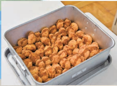
▲揚げたてのホタテのフライが 中学校に到着