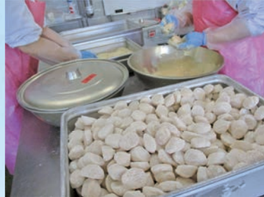
▲給食センターでホタテを調理 まずは揚げるための下準備