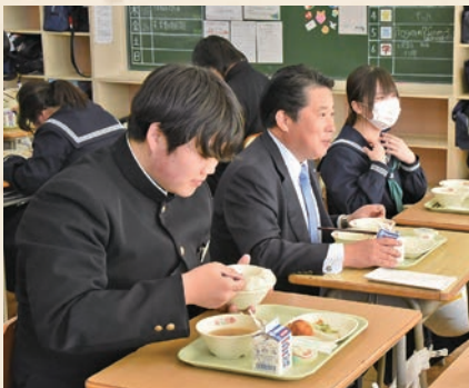
▲町長も「美味しい!」と太鼓判