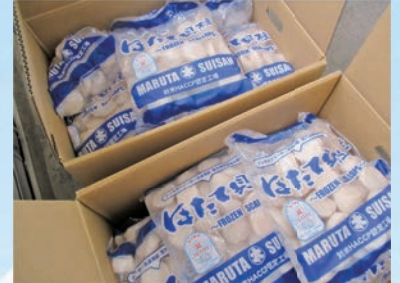
▲冷凍された状態のたくさんのホタテ貝柱 が給食センターに届きました