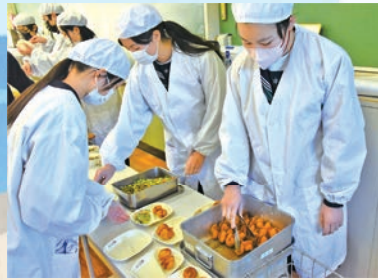
▲給食当番がそれぞれの皿にとり分けました