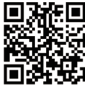
▲ポリテクセンター君津