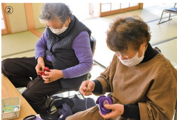
①町長のお話熱心に耳を傾ける生徒の皆さん