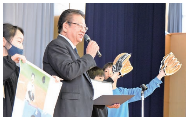
▲寄贈された大谷グローブのお披露目は大きく盛り上がりました