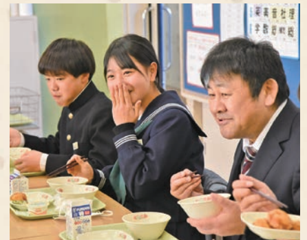
▲校長先生と笑顔でホタテを堪能しました