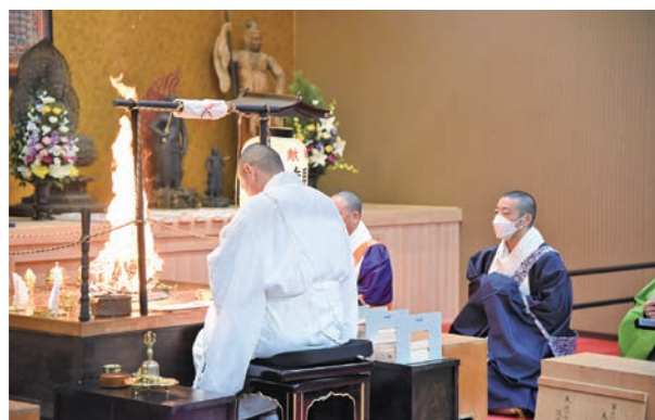
▲除災招福大護摩のときは炎が一際大きく昇りました

2月2日(金)、第二保育所にて「節分の会」が行われました。今年も鬼は来るのか気になる子どもたちの前に、鬼が登場。子どもたちは鬼の気迫に負けず、「鬼は外、福は内」の掛け声とともに元気よく鬼に豆を投げていました。豆まきの後、福拾いとして、お菓子を拾い、今年の福を集めました。