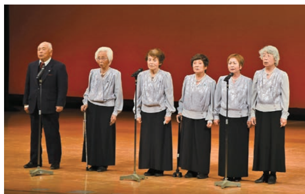
▲二人以上で吟じる「合吟」(岳風会)

2月3日(土)、芝山仁王尊観音教寺の護摩堂にて、節分会が行われました。今年は、数人の僧侶による経典の読み上げ「大般若転読」や、除災や求福のために七星を供養する「星供」など、除災招福を祈願した法要が行われました。参拝者はこれからも穏やかな日常が続くことを願いながら、大法要を受けていました。