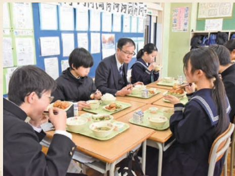
▲教育長も納得の美味しさ