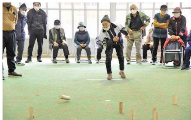
▲注目の決勝戦は手に汗握る素晴らしい試合でした

フィンランド発祥のスポーツ「モルック」はルールはシンプルですが試合の展開が読めず、とても盛り上がりました。