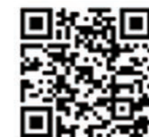
▲しばっこ保険ナビ予約サービス

す。（お一人のメールアドレスで複数人の予約は出来ません。） ・事業ごとに予約受付開始時期が異なります。それぞれの案内を確認いただき、予約受付期間内に予約ください。 ・従来通り、電話での予約受付も行ってまいります。