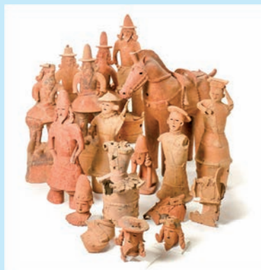
▲姫塚古墳出土埴輪群像