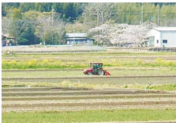
▲町の農業をどう守る

答 【町長】本町の耕作放棄地は約71ha、農地の貸借制度を周知し、新たな担い手を見つけられる施策を検討します。