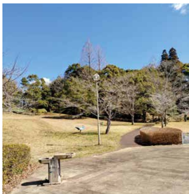
▲活気のある芝山公園へ

の子供たちが遊べる空間を利用者のニーズ等を把握しながら設置の可能性について研究して行きたいと思えます。