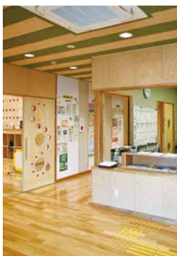
▲子どもたちを守るため、 防犯カメラの設置を (子育て支援センター入口)