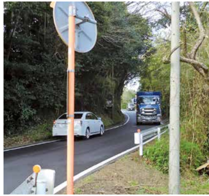
▲早期の拡幅が期待される小池7番地先

答 【町長】文化センター入口交差点の右折レーンの整備ですが、千葉県の所管で用地交渉等に取り組んでいると伺っています。小池丁字路交差点の改良計画は事業主体者の整理も含め検討していく必要があるとのこと。小池3番地先の道路拡幅は現