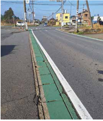
▲歩行者の安全が最優先

答 【町長】歩行者の安全確保が重要ですので千葉県に要望します。町道区間も早期に整備できるように現地調査に取り組みます。