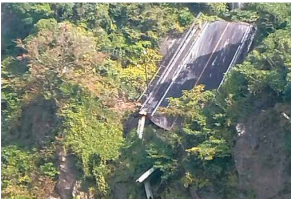
▲熊本地震で崩壊した道路

員に配布し、確認させております。避難所運営については、令和2年7月に避難所運営マニュアルを作成しており、町ホームページにも掲載していますので、広く情報共有がされているものと考えています。