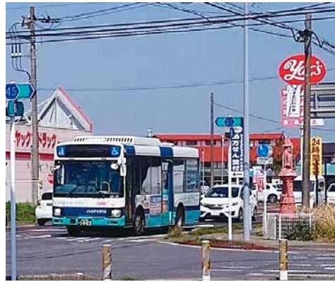
▲町にバス停が新設される横芝光号

A 6月頃の実施で風和里しげやまと芝山中学校前の2カ所に停留し年間負担額は約1600万円を予定しております。