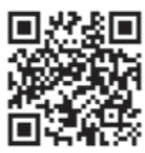
↑ラブラッドアクセスQRコード

★ラブラッドのアプリができました。 電話予約 予約受付フリーダイヤル0120-0892-760 (平日の午前9時～午後5時)にご連絡ください。