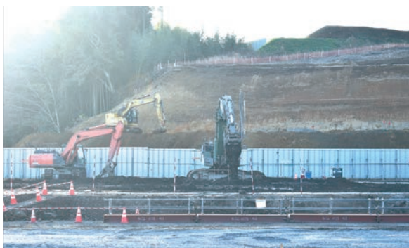
▲北側トンネルでは、地盤の軟弱な場所にコンクリート乳剤を混ぜ込み地盤沈下が起こらないようにしています