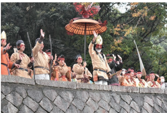
▲盛大に開催された第40回芝山はにわ祭

答 【町長】メイン会場の傾斜は認識しておりますが、財政の関係からすぐに解消とはいきません。また、メイン会場を別の場所で開催すると言う選択もあります。すが、いずれにいたしましても、はにわ祭実行委員会の皆さんと検討して行かなければならないと認識しております。