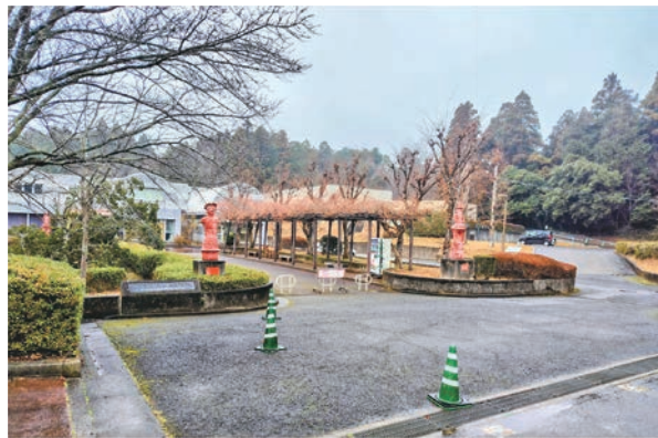
▲はにわ博物館駐車場

答 【町長】駐車場については、狭いと思いますし、全体的にはにわ博物館の改修をどうしていくかということは必要とされています。今すぐとはいきませんが必要なところの改修を洗い出して計画を立てる必要があると思っています。