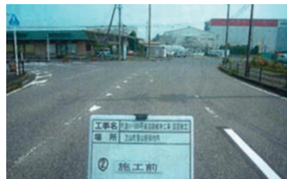
▲ 01-009 号線（香山新田）着工前