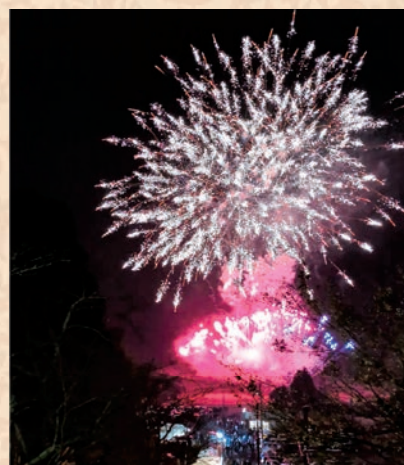
▲大成功の芝山カウントダウン花火。700発の花火は大迫力、大盛り上がり