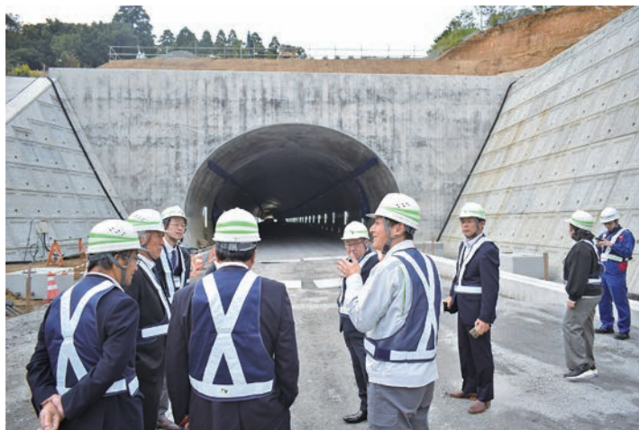
▲開通が待ち遠しい圏央道

県内で唯一の未開通区間である大栄JCTから松尾横芝IC約18.5kmが2026年度（大栄JCTから多古IC区間は令和8年秋頃開通予定）を目指して工事中です。また同区間内に三つ目となるIC設置を千葉県知事と成田空港会社社長が国に要望書を提出しております。山武市には山武PA（仮称）が早期供給を目指し事業が進められています。