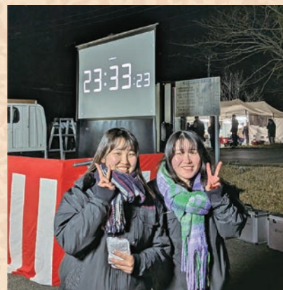
▲町長や議長、実行委員会が立つステージの司会を担当