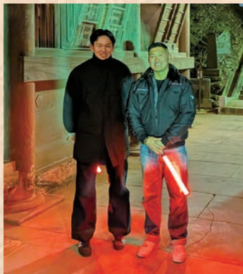
▲花火を見に来た多くの来場者に対応し、警備や案内する青年団