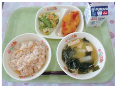
▲地産地消で美味しい給食は芝山町の魅力

【町長】豊かな自然、手厚い保育、給食費無償化などは大きな強みです。町で出来る現状として、最大限の子育て支援をしています。ただし、自治体間での単なる人口の奪い合いのための子育て支援ではなく、地元で子どもを産んで人を増やすことが一番大事です。また、空港機能強化や将来の構想と連動し、本町ならではの特色を磨くことが重要です。今後さらに施策を積み上げ、「芝山町に住んでよかった」と思えるまちづくりをしていきます。