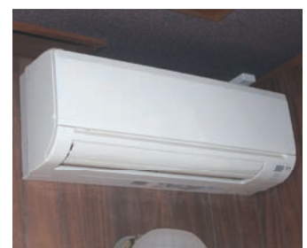
▲夏冬フル稼働の空調機

答 【町長】代執行は、周辺住民の生命、身体又は財産に危害が及ぶ危険等の切迫性が極めて高い場合、所有者が命令に応じない又は所有者が特定できないといった限定的状態に実施するもので、当町においても緊急的な対応を求められた場合の対応体制を整えています。