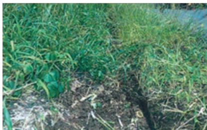
▲ 2BL-0024 号線（岩山）着工前