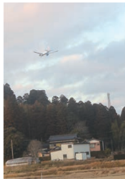
▲旧谷間地区を飛行する航空機