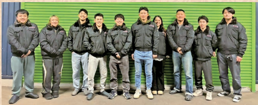
▲楽しく笑顔と笑いあふれる青年団

カウントダウン花火の準備や、実行委員会での打合せ、SNSでの宣伝とその為の取材等、毎月数回集まっています。