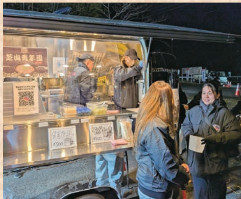
▲カフェ「空と豆」協力の元、もつ煮と年越しそばを提供する出店も運営