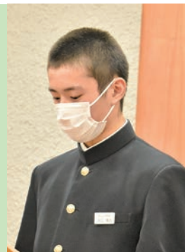
井口 瑛太 議員