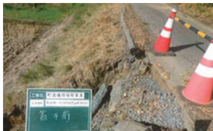
▲ 1BL-0130 号線（境）着工前

まちづくり常任委員会にて、まちづくり課に対して道路維持管理についての所管事務調査を行いました。まちづくり課から道路維持管理に関する説明を受けました。緊急性の高い道路舗装修繕に関して、道路パトロールや住民の方からの通報があった際には、職員が現地を確認して対応している報告がありました。