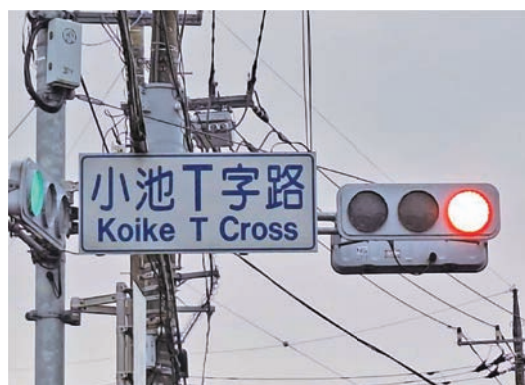
▲小池T字路を時差式へ要望

問 国道296号線とはにわ道との交差点「岩山」。はにわ道の上下線とも10秒でも伸ばすことは出来ないか。