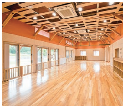
▲子育て世代の交流の場として貴重な子育て支援センター「はぐーん」

【町長】アンケートでも要望があり、ニーズは認識しています。職員配置や支援員の確保など課題はありますが、協議を重ねながら前向きに検討していきます。