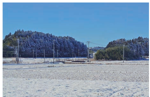
▲高谷川沿には機能補償道路が新設予定

答 【町長】残地への対応を含め、地権者の意見や考えに真摯に対応するようNAAに求めています。