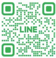
▲制服リリース 公式LINE

メンバーは、「まだ使える物を必要な方に届けられ、活動を通じて地域の方と関わる機会も増える。」と語り、ハニワをテーマにした活動だけでなく、様々な形で地域貢献に取り組んでいます。