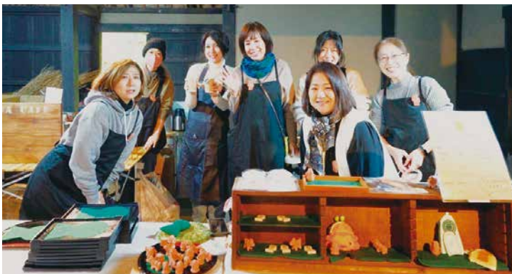
▲旧敷家住宅で開催されたカフェの様子

最後に「これからも楽しみながら自分たちのペースで活動していきますので、ぜひ応援してください。」とメッセージをいただきました。