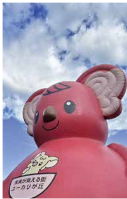
▲ふわふわトランポリンも登場!

■内容 マルシェ(農産物販売・飲食・ワークショップなど)、ふわふわトランポリン、夏野菜作付けイベント(※事前申込制)、まちづくり説明会