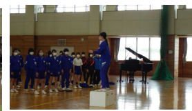
在校生の歓迎の歌