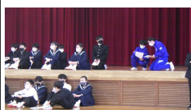
新入生にインタビュー!?